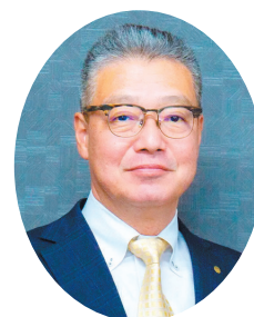
一般財団法人 盛岡市勤労者福祉 サービスセンター