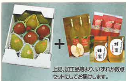
上記、加工品等より、いずれか数点セットにしてお届けします。

※品種はお任せください。上記加工品とは、「干りんご・蜂蜜・ジュースほか」です。 ※画像はイメージです。