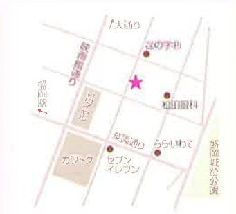
菜園マイクロブルワリー with kitchen (旧 クッチーナ)

岩手発の醸造設備を併設したブルワリーパブのビールの製造行程を間近で眺め楽しみながら味わうことができます。