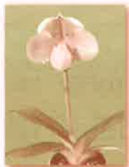
世界らん展日本大賞2016 日本大賞受賞花