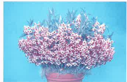
世界らん展日本大賞2012大賞花