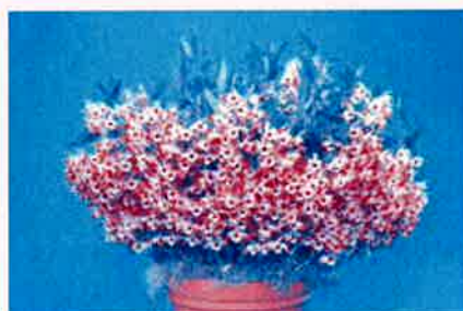
世界らん展日本大賞2012大賞花